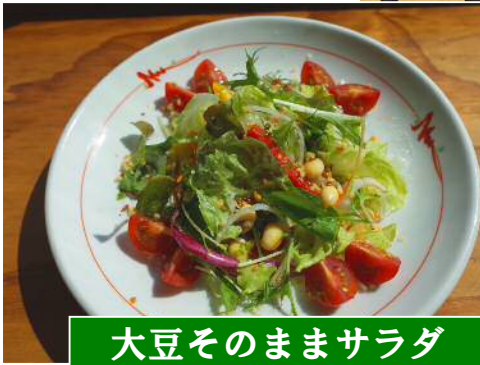
大豆そのままサラダ